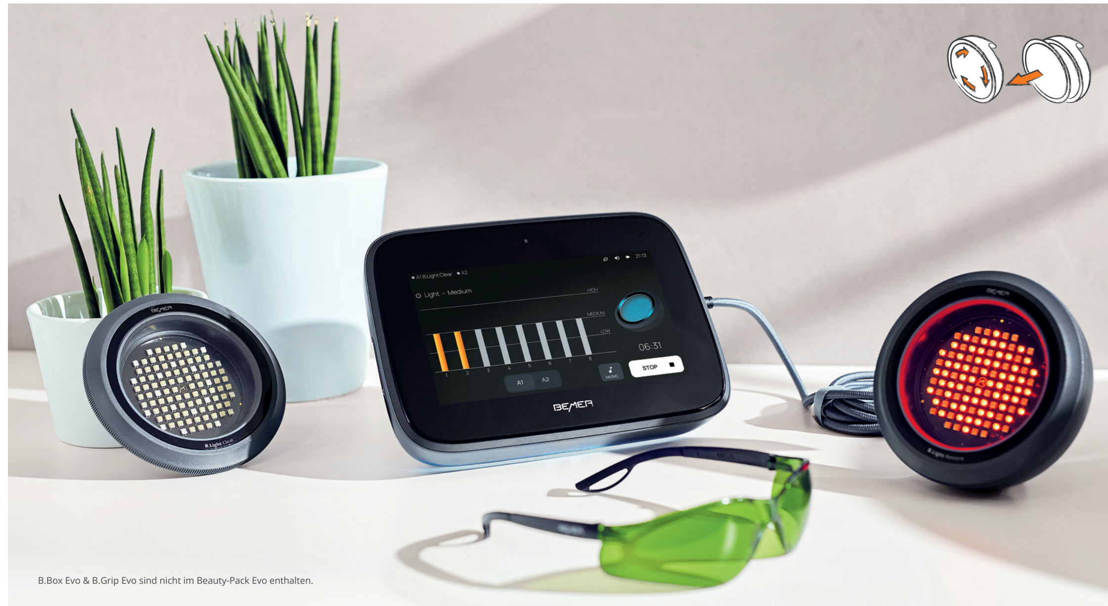
B.Box Evo & B.Grip Evo sind nicht im Beauty-Pack Evo enthalten.